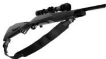
(Correa simple de dos puntos de anclaje)

Correa con un solo punto de fijación al arma y el extremo opuesto a modo de cabestrillo alrededor del brazo.