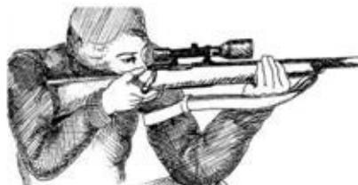
(Correa de cabestrillo).

18.4 - Al margen de los indicadores de tipo péndulo de hilo o similar y en algunos casos la cuerda del blanco, se podrán utilizar únicamente para la estimación del viento los elementos naturales que se hallen en el puesto de tiro, siempre y cuando su uso no moleste al resto de los competidores.